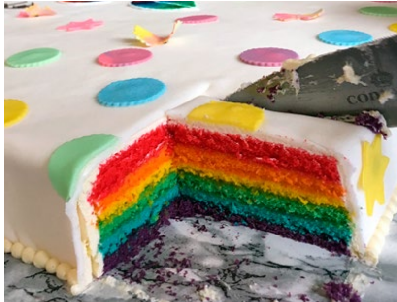
▲ Berlin, 08.05.2017 - „Kiss Kiss Berlin - Regenbogenkuchen“, gestiftet von Café Einstein Stammhaus in der Kurfürstenstraße.

Staatssekretärin für Justiz, Verbraucherschutz und Antidiskriminierung.