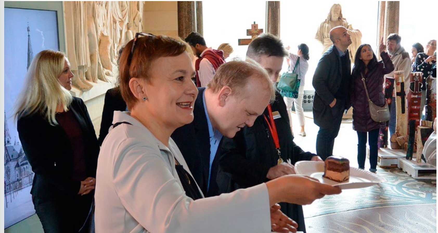
lichen Kirchen Berlin-Brandenburg-schlesische Oberlausitz, verteilt den Kuchen, der vom Hotel Palace Berlin gestiftet worden war.