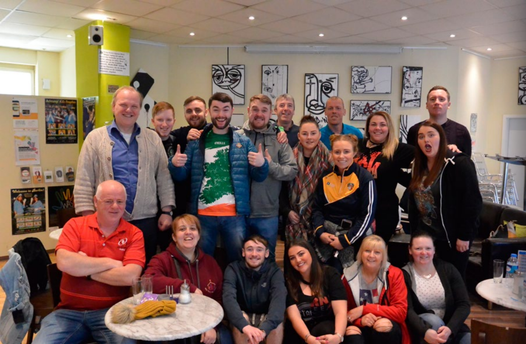
Foto: Besuchergruppe aus Belfast zu Gast bei MANEO.