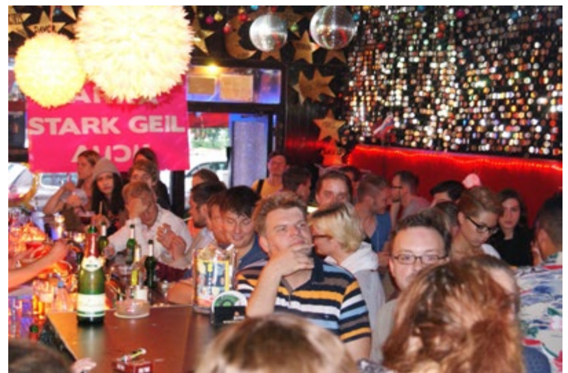
Foto: Das Rauschgold in alten Zeiten, die hoffentlich auch bald wiederkommen.

Weitere Infos über das Rauschgold: https://rauschgold.berlin