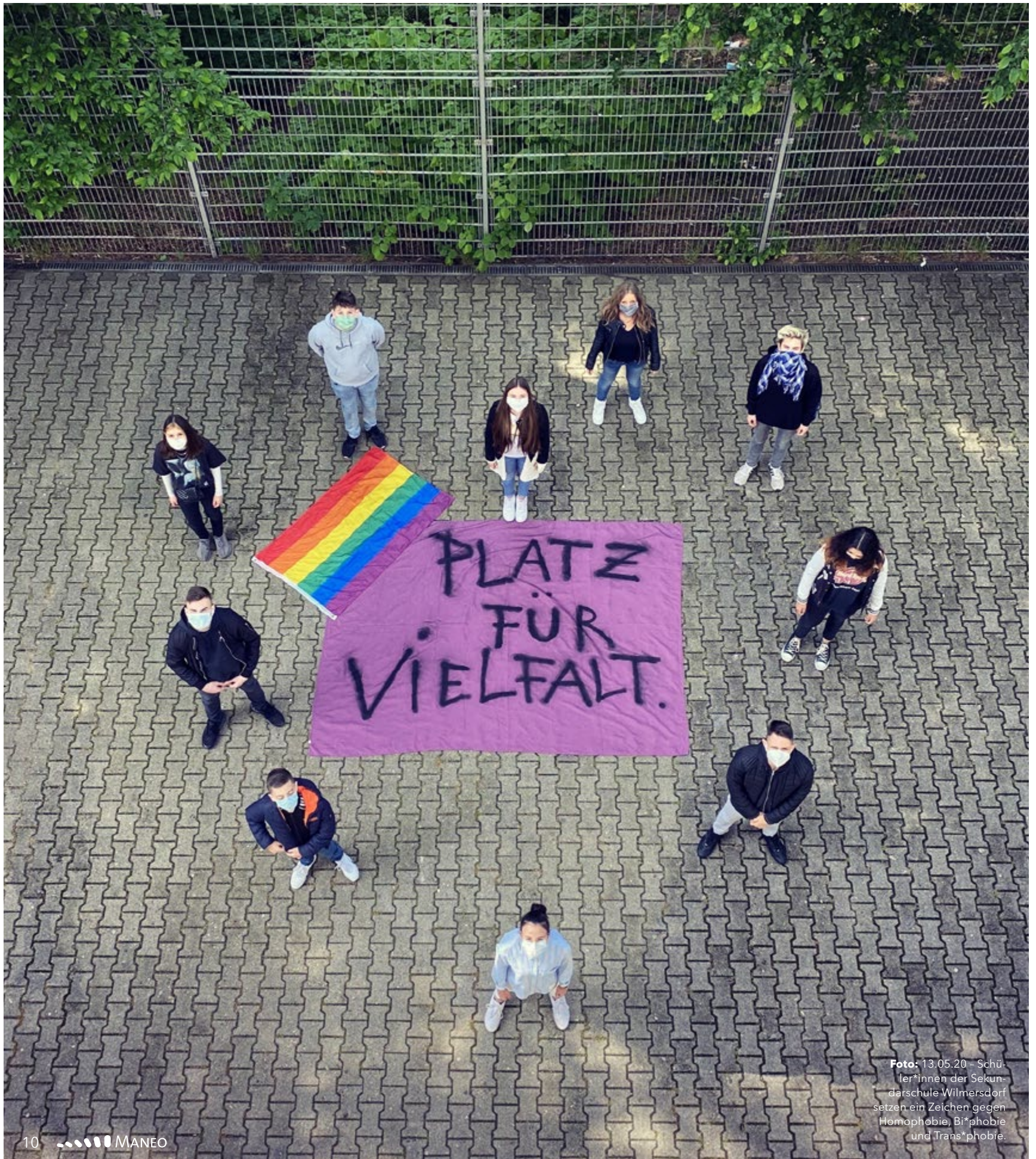
Foto: 13.05.20 - Schüler*innen der Sekundarschule Wilmersdorf setzen ein Zeichen gegen Homophobie, Bi*phobie und Trans*phobie.