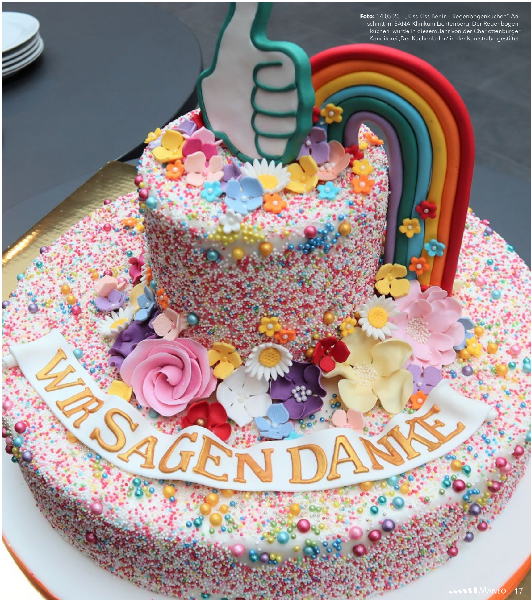
Foto: 14.05.20 - „Kiss Kiss Berlin – Regenbogenkuchen“-Anschnitt im SANA-Klinikum Lichtenberg. Der Regenbogenkuchen wurde in diesem Jahr von der Charlottenburger Konditorei ‚Der Kuchenladen‘ in der Kantstraße gestiftet.